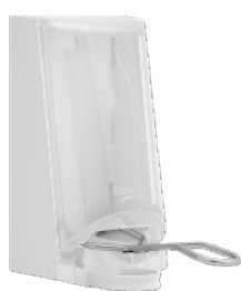
Art nr 4567