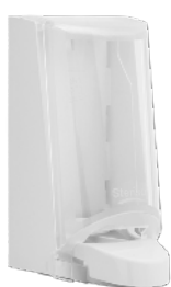
Art nr 4551