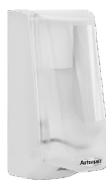
Art nr 4546